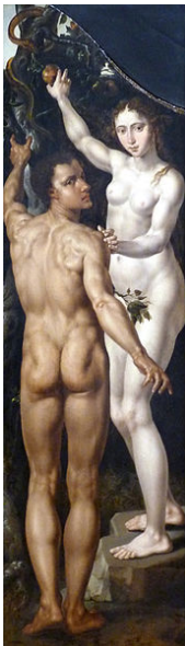
Adam u. Eva