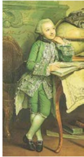
Friedrich Franz I.

† am 1. Febr. 1837 in Ludwigslust, bestattet im Doberaner Münster