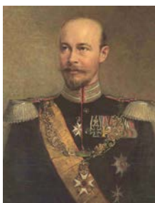
Friedrich Franz III.

Friedrich Franz III. Paul Nikolaus Ernst Heinrich, * am 19. März 1851 auf Schloss Ludwigslust. S. u. N. von Ghzg. Friedrich Franz II. u. Prinzessin Auguste v. Reuß-Schleitz-Köstritz, * am 26. Mai 1822, † am 3. März 1862. Taufe am 3. Mai 1851 im Goldenen Saal im Schloss von Ludwigslust.