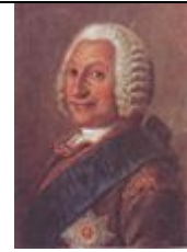
Adolf Friedrich III.

Herzog v. Mecklenburg-Strelitz (1708-1752). Ehe am 16. April 1709 mit Dorothea Sophie, * am 4. Dez. 1692, † am 29. April 1765, T. von Herzog Johannes Adolf v. Holstein-Plön. Kinder: Maria Sophie, * am 5. Mai 1710, Nonne, † am 21. Febr. 1728 Magdalene Christine, * am 21. Juli 1711, † am 27. Jan. 1713 † am 11. Dez. 1752