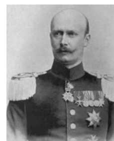
Regent Johann Albrecht