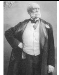
Friedrich Wilhelm II.

Strelitz u. Marie, * am 21. Jan. 1796, † am 30. Dez. 1880, T. von Lgf. Friedrich III. v. Hessen-Kassel u. Karoline Polyxena v. Nassau-Usingen. Studium der Geschichte in Bonn. Großherzog v. Mecklenburg-Strelitz seit 6. Sept. 1860 Ehe am 28. Juni 1843 in London mit Cousine Prinzessin Auguste Karoline v. Cambridge (1903 Diamantene Hochzeit), * 1822, † 1916, T. von Hzg. Adolph Friedrich v. Cambridge u. Vizekönig v. Hannover u. Auguste Przn. v. Hessen-Kassel. Kinder: Sohn, * u. † 1843 Friedrich Wilhelm, * u. † 1845 Adolph Friedrich V. ; * 1848, Erbghzg. v. Mecklenburg-Strelitz, † 1914. Ehe mit Przn. Elisabeth v. Anhalt-Dessau. † am 30. Mai 1904 in Neustrelitz