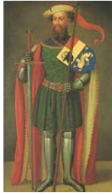
Magnus I. Herzog