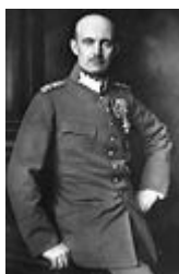
Friedrich Franz IV.

Friedrich Franz IV., * am 9. April 1882 in der Villa Belmonte zu Palermo. S. u. N. von Ghzg. Friedrich Franz III. u. Anastasia Michailowna, Großfürstin v. Russland, * am 28. Juli 1860, † am 11. März 1922, T. von Großfürst Michail Nikolajewitsch. Großherzog v. Mecklenburg-Schwerin seit 10. April 1897. Fürst zu Wenden, Schwerin u. Ratzeburg, Graf zu Schwerin, Herr der Lande Rostock u. Stargard.