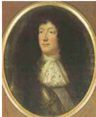
Christian (Louis) I.