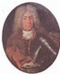
Adolf Friedrich II.

Herzog Adolf Friedrich II. 1701 - 1708 * 19. 10. 1658 † 12. 5. 1708