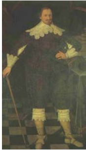
Adolf Friedrich I.

wurde Adolf Friedrich I. als Unterstützer dänischer Truppen von Kaiser Ferdinand II. am 19. Jan. 1628 in Acht erklärt u. mussten Herzog Wallenstein, * am 24. Sept. 1583, † am 25. Febr. 1634, weichen. Dieser regierte als Albrecht VIII. Wallenstein (1628-1631). Im Mai 1628 verließen sie, von jenem gedrängt, das Land, in welches sie nach seinem Sturz im Mai 1631 mit Hilfe der schwedischen Truppen zurückkehrten. Sie mussten hierfür Wismar mit der Insel Poe, Neukloster u. Warnemünde an Schweden abtreten. Reformen Wallensteins wurden selbst zum Schaden des Hofes peinlichst genau zurückgenommen. Skrupelloser Herrscher. Administrator v. Schwerin (1634-1648)