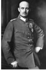
Friedrich Franz IV.

der Abdankung des Kaisers. Verzichtete für sich u. sein Haus auf den Thron u. emigrierte nach Dänemark.