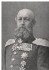
Friedrich Franz II.

Großherzog Friedrich Franz II. 1842 - 1883 * 28. 2. 1823 † 15. 4. 1883