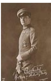
Adolf Friedrich VI.

Großherzog Adolf Friedrich VI. 1914 - 1918 * 17. 6. 1882 † 24. 2. 1918