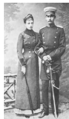
Friedrich F. III. u. Anastasia

† am 10. April 1897 in Cannes. Bestattet im Helenen-Mausoleum zu Ludwigslust.