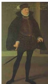
Johann Albrecht I.

Herzog Johann Albrecht I. 1552 - 1576 * 25. 12. 1525 † 12. 2. 1576