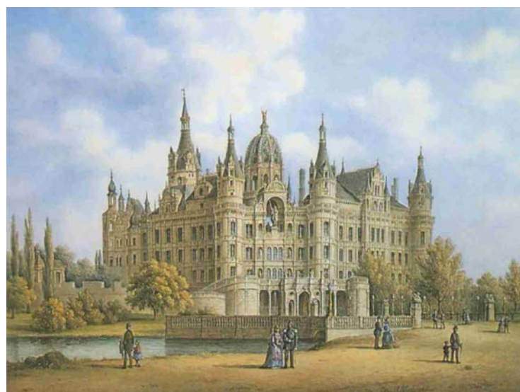
Schloss Schwerin nach dem Umbau im 19. Jh.