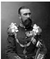
Adolf Friedrich V.

Großherzog Adolf Friedrich V. 1904 - 1914 * 22. 7. 1848 † 11. 6. 1914