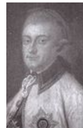
Adolf Friedrich IV.

Adolf Friedrich IV., * am 5. Mai 1738 in Mirow. Sohn von Erbprinz Karl Ludwig Friedrich, † am 4. Juni 1752 (Sohn von Herzog Adolf Friedrich II. v. Mecklenburg-Strelitz) u. Albertina Elisabeth, T. von Herzog Ernst Friedrich v. Sachsen-Hildburghausen. Nachfolger u. Neffe von Herzog Adolf Friedrich III. v. Mecklenburg-Strelitz. Herzog v. Mecklenburg-Strelitz (1752-1794). Mündigkeitserklärung am 17. Jan. 1753. Erhielt er als erster mecklenburgischer Fürst 1764 den Hosenbandorden. Zu seinen Lebzeiten musste eine kaiserliche Kommission zur Schuldenregulierung eingesetzt werden. Unverheiratet u. kinderlos † am 2. Juni 1794 in Neustrelitz