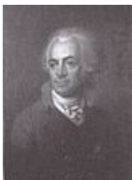
Ghgz. Karl II.