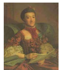
Charlotte Sophie Gem. Ludwigs

Herzog Friedrich 1756 - 1785 * 9. 11. 1717 † 24. 4. 1785