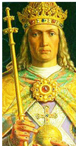
Ks. Ludwig IV. d. Bayer (1282–1347)

Zwei Kaiser u. ein röm.-dt. König wurden erwählt u. stellten Könige in Ungarn, Schweden, Dänemark, Norwegen u. Griechenland.